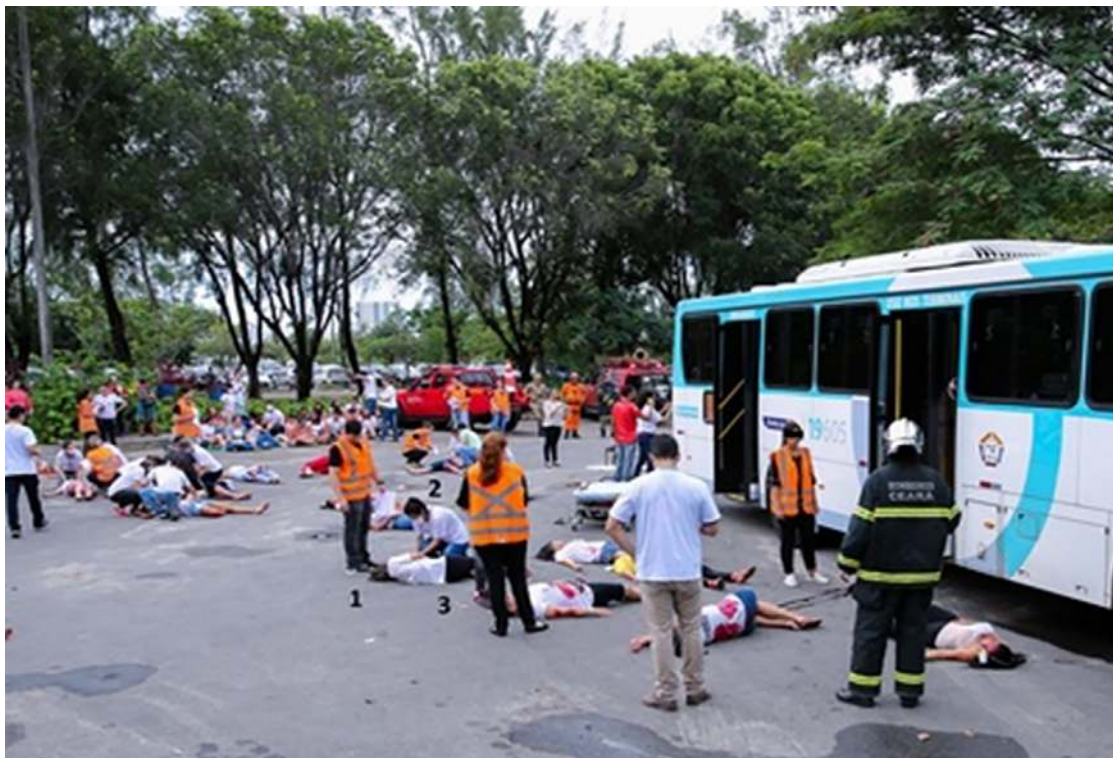
Figura 1. Ambiente de simulação de IMV na Universidade: 1) aluno-sombra; 2) aluno em avaliação; 3) vítima.