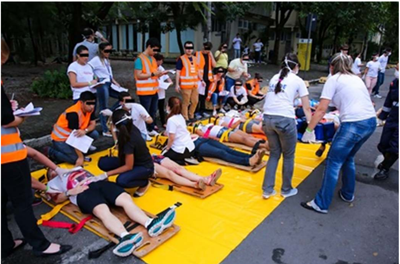
Figura 2. Lona de atendimento das vítimas de acordo com método START.

A partir dos dados de 17 checklists preenchidos corretamente das vítimas classificadas como vermelhas e amarelas (Tabela 2), verificou-se que na aplicação do mnemônico da avaliação primária ao trauma ABCDE (A- via aérea e controle cervical, B- ventilação, C- circulação, D- avaliação neurológica, E- exposição e controle da hipotermia)